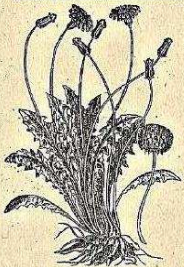
Nel fecondo lib. di Dioscoride. 533 CICORBA CONSTANTINOPOLITANA.

testi a cura dell'Assessorato alla Cultura del Comune di Montegabbione