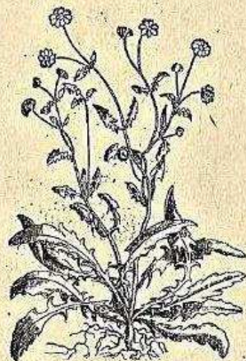
Discorsidel Matthioli CICORBA FERRUGARIA.